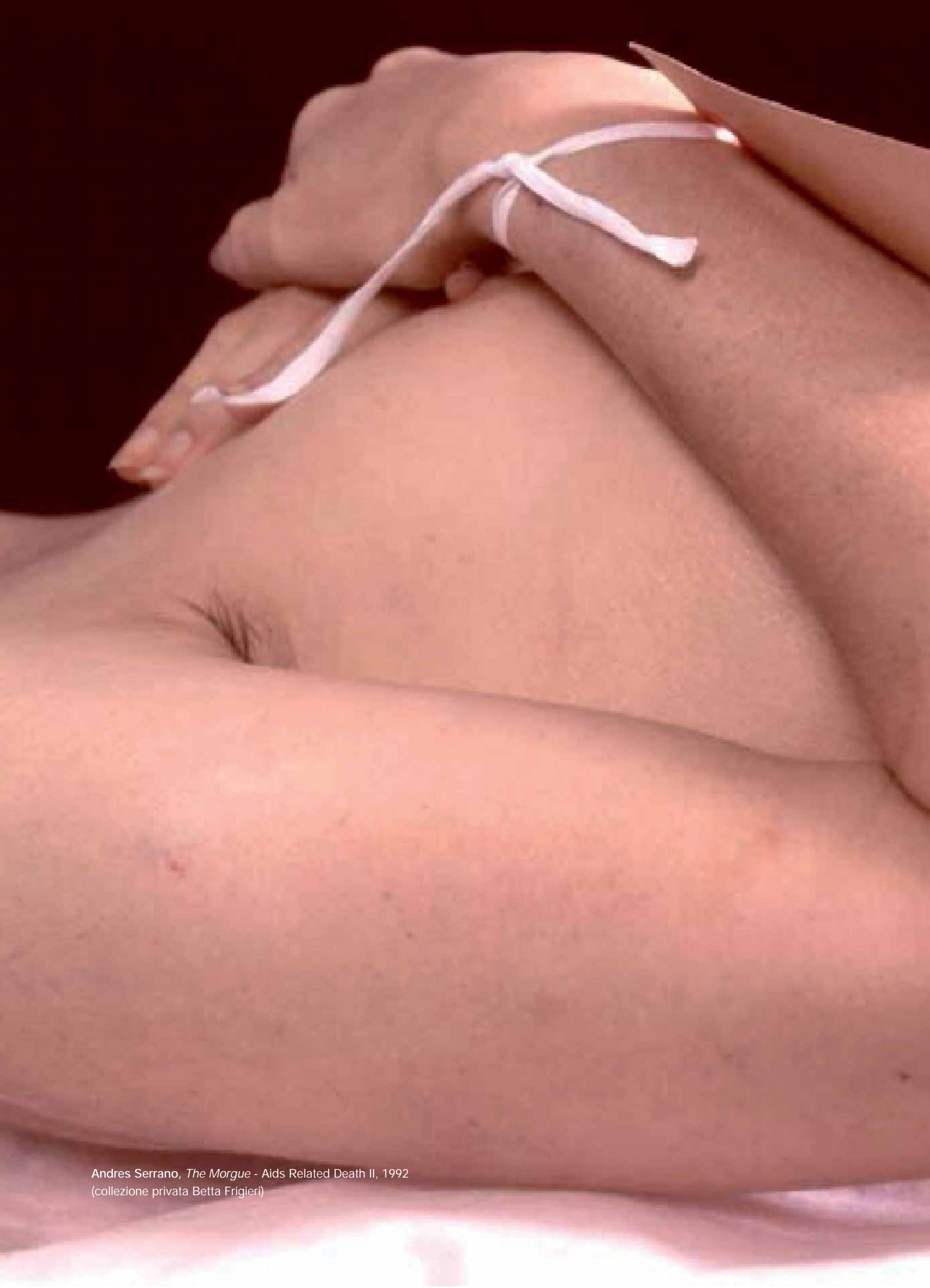
Andres Serrano, The Morgue - Aids Related Death II , 1992 (collezione privata Betta Frigieri)